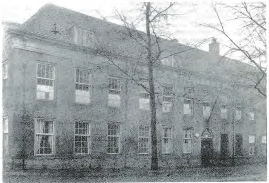
De voormalige Benthienkazerne, thuisbasis voor pontoniers en torpedisten te Dordrecht.